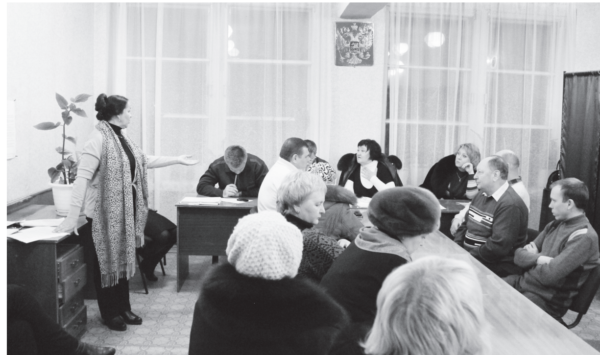
• Давайте определимся, кто мы?