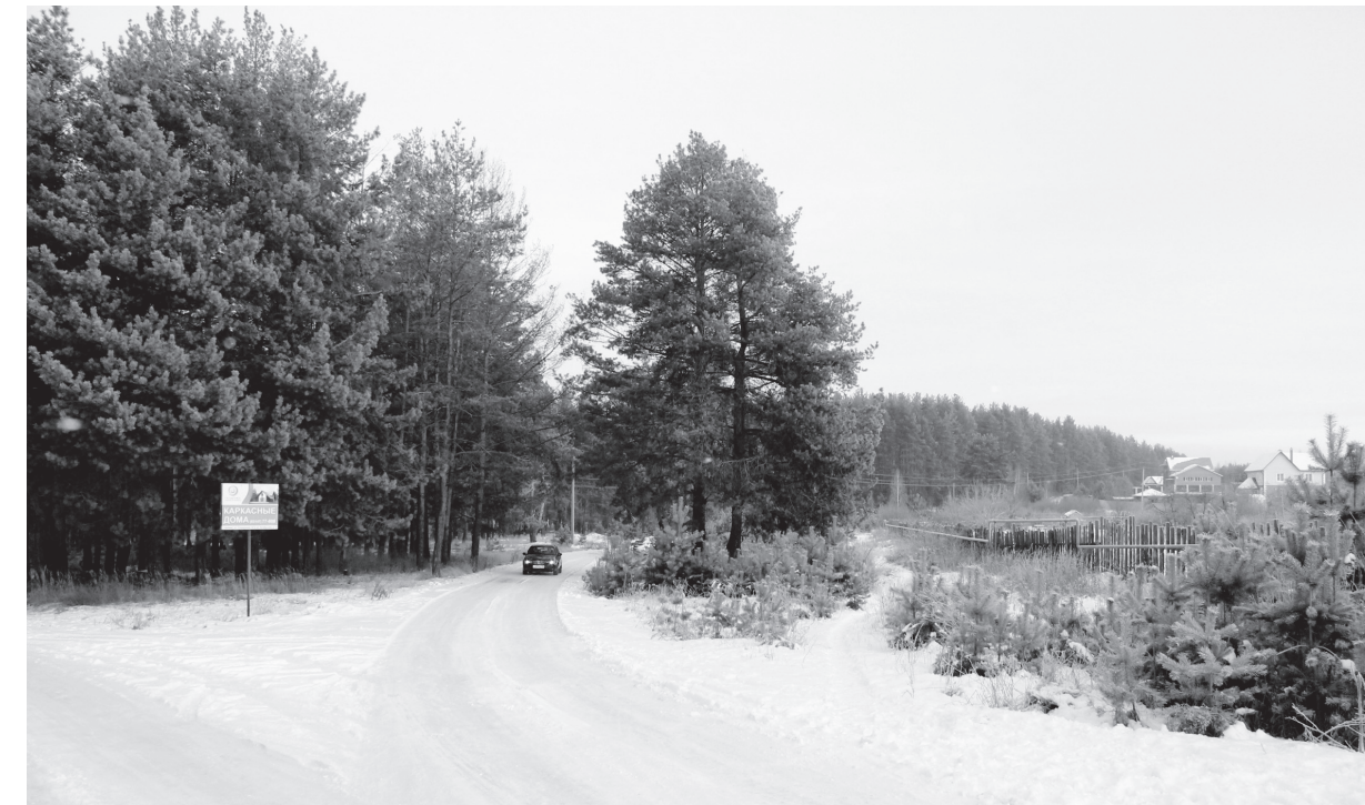
• Дорога, ведущая к кооперативу «Оксский»

где трудятся 60 шиморян, является довольно крупным, по масштабам посёлка, предприятием, могущим инициировать проекты, касающиеся всего населения, например, в сфере строительства и ремонта дорог. Для справки: с такой инициативой три недели назад выступил и сам Совет, направивший письмо-обращение в региональный Дорожный фонд.